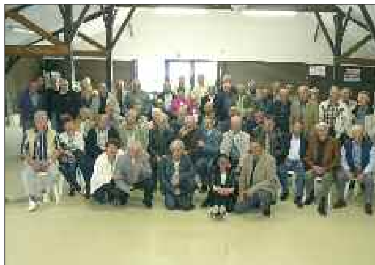
Cette année, retrouvailles périgourdines