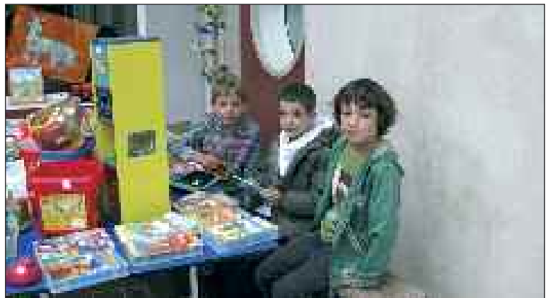
Les enfants étaient très mobilisés