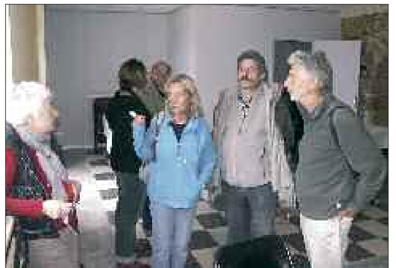
Les comédiens dans la salle d'exposition