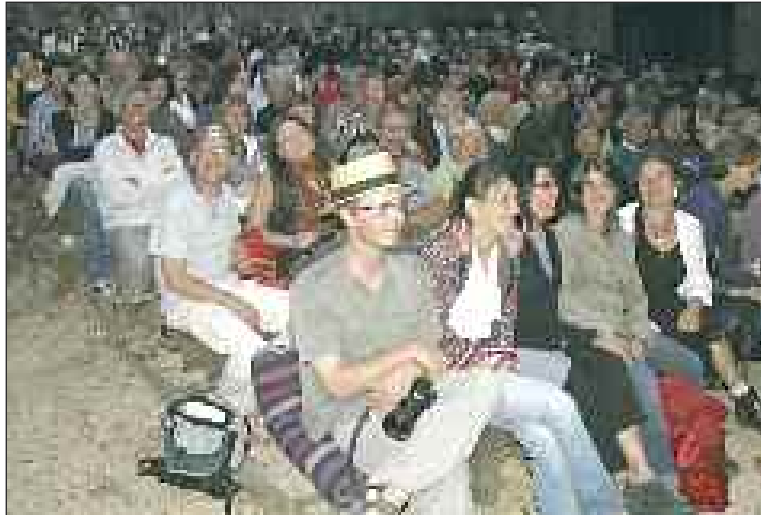
Lors d'une représentation en 2009