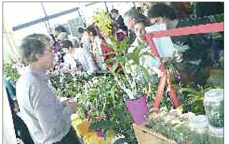
Au gré des stands