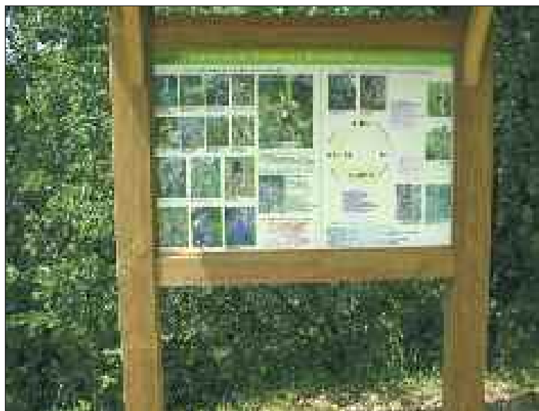
Le panneau explicatif