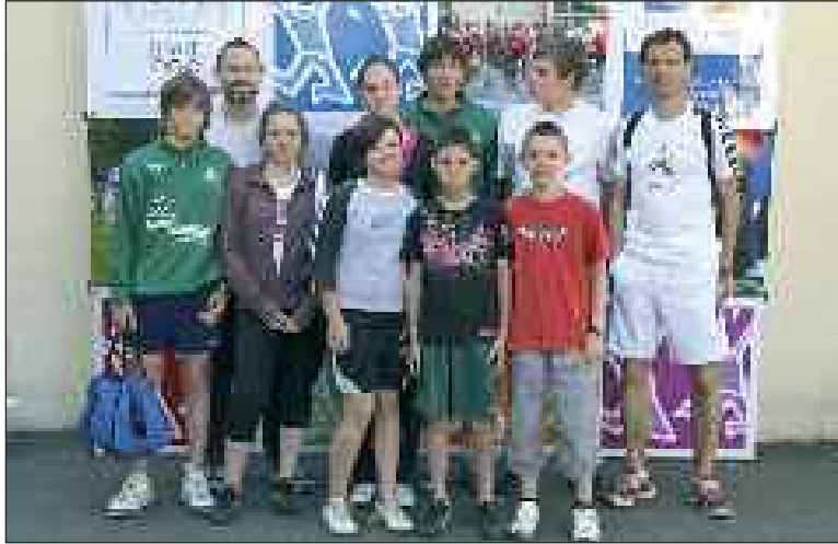
L'équipe et ses éducateurs