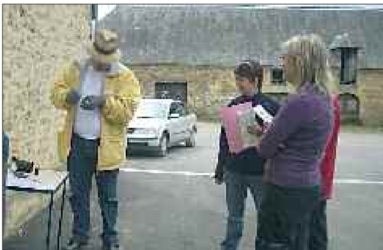
Les vainqueurs de l'épreuve de couture avec gants !

Samedi 1 er mai, la soixantaine de participants au 25 e Rallye de l'Amicale a pris place à bord des seize voitures. Les départs se sont échelonnés de 8 h à 8 h 30 de la place de la Halle pour un périple de 140 km vers Milhac, le château de Fénelon, Souillac, Eyvigues, Salignac, Paulin, Archignac, Saint-Amand-de-Coly. Le retour s'est fait par Montignac, Saint-Léon-sur-Vézère, Tamniès, Proissans, pour une arrivée à Carlux.