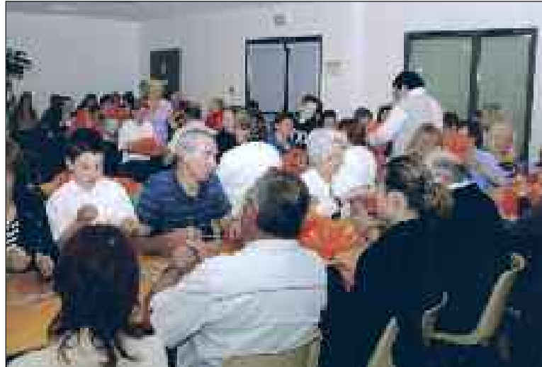
Près de 20 000 fleurs en neuf soirées...