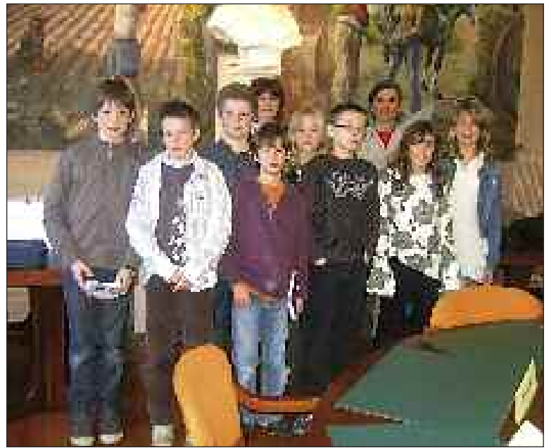
Le conseil municipal jeunes